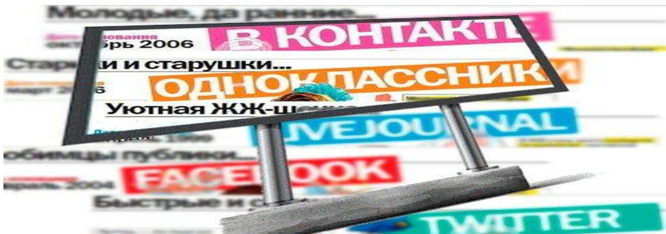
Рисунок 5 - Пример рекламы в социальных сетях

разработку и внедрение, а также умение правильно настроить рекламную кампанию, но это вы можете доверить SMM-специалисту.