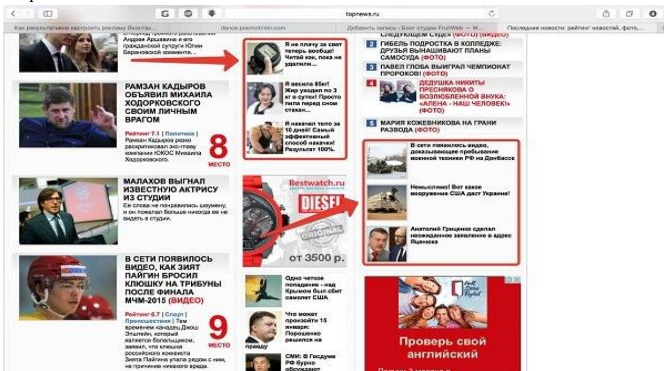
Рисунок 4 - Пример тизерной рекламы

4. Тизерная реклама. С такими объявлениями знаком каждый пользователь интернета. Это небольшие блоки с картинками и вызывающими заголовками в духе «Владимир Путин решил важный вопрос для всей страны...», которые можно увидеть на самых разных сайтах. Главная цель при создании тизерного объявления — шокировать и заинтриговать посетителя. Будет ли содержание страницы, на которую перейдет пользователь, соответствовать объявлению — уже вторично