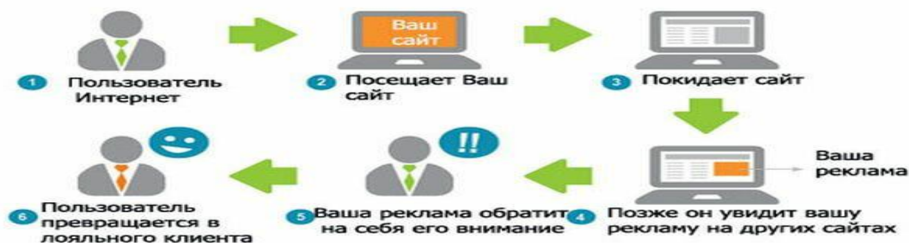
Рисунок 9 - Пример действия вирусной рекламы

2. Вирусная реклама – в интернете действует по принципу сарафанного радио. Создается какой-то информационный повод, который быстро распространяется по Сети и привлекает к себе всеобщее внимание. Это может быть необычная картинка, забавный ролик на Youtube и даже постановочный сюжет. Если грамотно подойти к разработке рекламной кампании и удачно уловить современный тренд, это может по-настоящему «выстрелить».