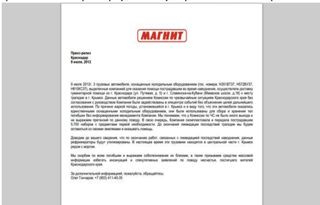
Рисунок 6 - Пример пресс-релиза

6. Статьи или пресс-релизы. Этот вид рекламы предполагает публикацию на новостном сайте или популярном портале небольшого анонса или полноценной статьи на конкретную тематику. Это может быть обзорная статья про компанию, презентация товара или услуги, новость об открытии филиала и так далее. При грамотном составлении текста и правильном выборе площадки для размещения такая реклама покажет хорошие результаты и будет работать длительное время.