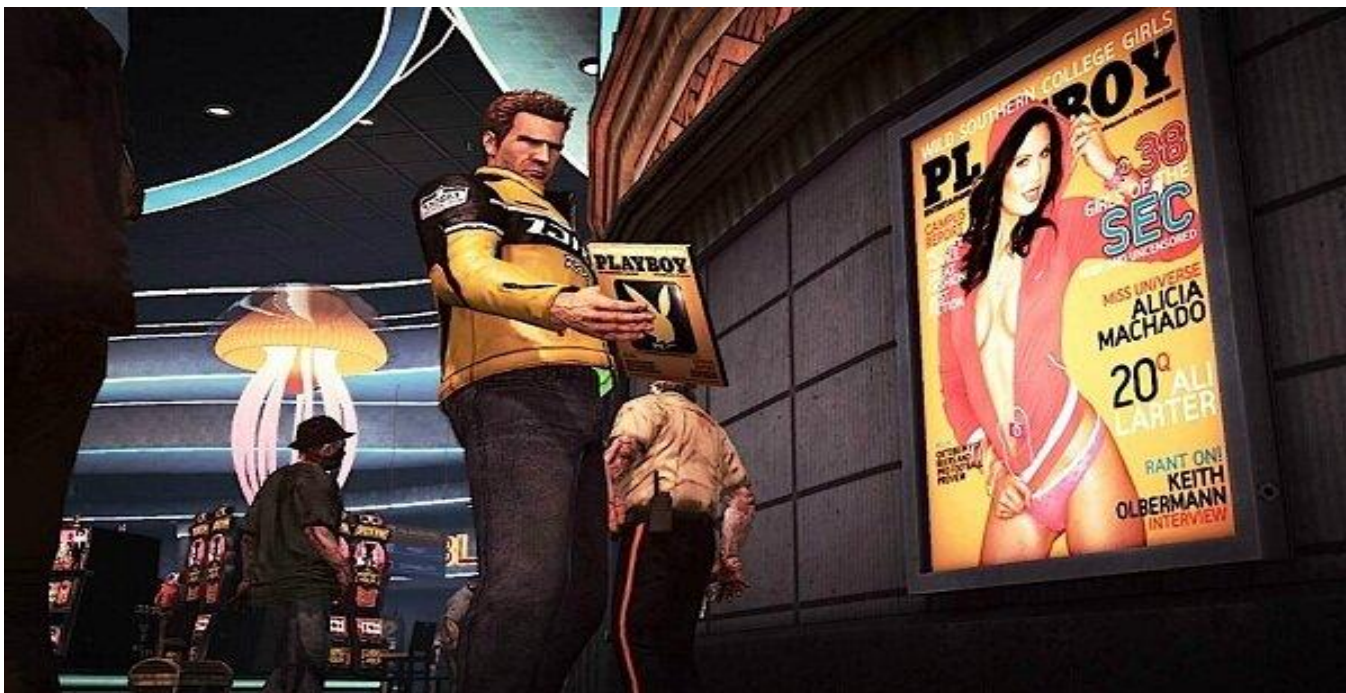
Рисунок 8 - Пример продакт-плейсмент

1. Скрытая реклама или продакт-плейсмент. Данный подход известен маркетологам уже давно. Это ненавязчивая реклама, которая появляется как бы между делом. Например, герой фильма может курить сигареты определенной марки или при входе в супермаркет на заднем фоне будет висеть рекламное объявление известной компании. В фильмах и сериалах такой подход используется не первый год. Что до интернета, то здесь продакт-плейсмент появился относительно недавно и в основном его используют в компьютерных онлайн-играх. Бренды могут появляться где-то на фоне игрового процесса, показываться игрокам или внедряться в сам игровой процесс. Все это позволяет привлекать внимание к торговой марке и создавать положительную репутацию для последующего продвижения.