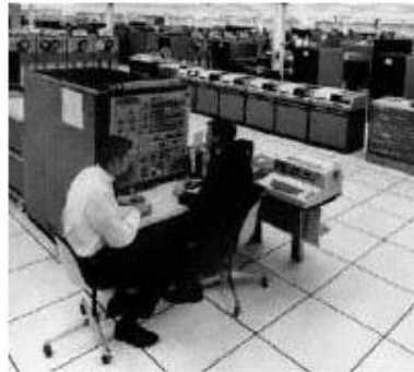
Компьютер IBM-360. Третье поколение