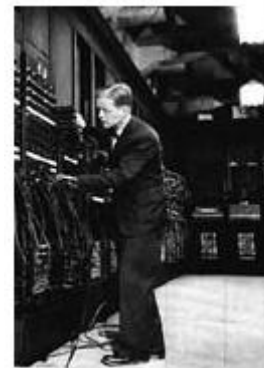
Компьютер "Эниак". Первое поколение

Набор команд был небольшой, схема арифметико-логического устройства и устройства управления достаточно проста, программное обеспечение практически отсутствовало. Показатели объема оперативной памяти и быстродействия были низкими. Для ввода-вывода использовались перфоленты, перфокарты, магнитные ленты и печатающие устройства.