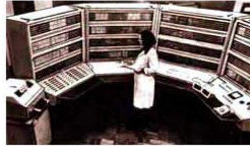
БЭСМ-6. Второе поколение

Второе поколение компьютерной техники — машины, сконструированные примерно в 1955-65 гг. Характеризуются использованием в них как электронных ламп , так и дискретных транзисторных логических элементов . Их оперативная память была построена на магнитных сердечниках. В это время стал расширяться диапазон применяемого оборудования ввода-вывода, появились высокопроизводительные устройства для работы с магнитными лентами, магнитные барабаны и первые магнитные диски .