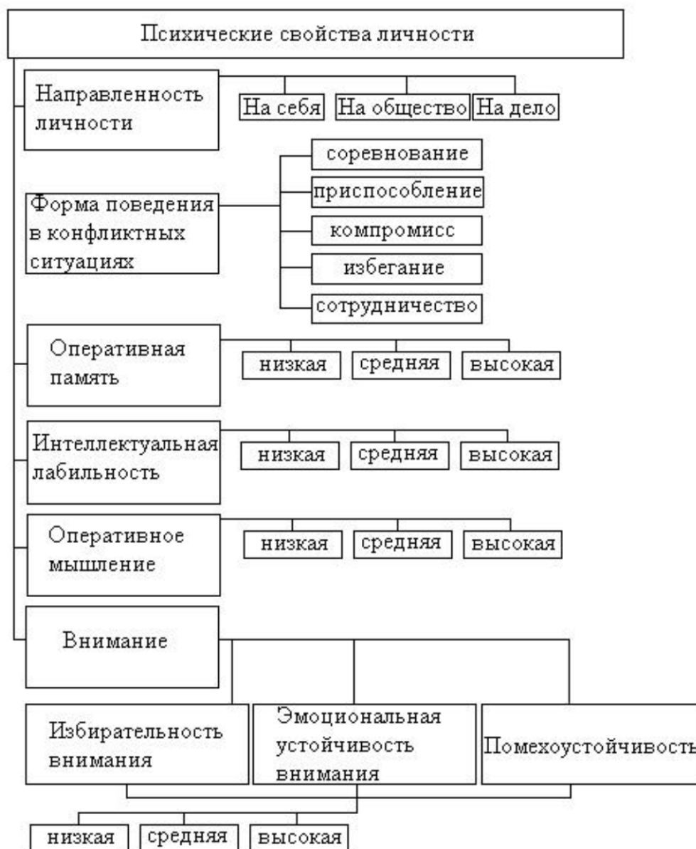
Оценка основных психических свойств человека

- При выраженной направленности на общество – «О» – вы становитесь зависимы от коллектива. Стремление во что бы то ни стало поддерживать добрые отношения в коллективе приводит к ухудшению общих дел. В конечном итоге вы становитесь виновником всех бед.